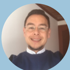
Giovanni Garzón Ministerio de Educación Nacional Colombia